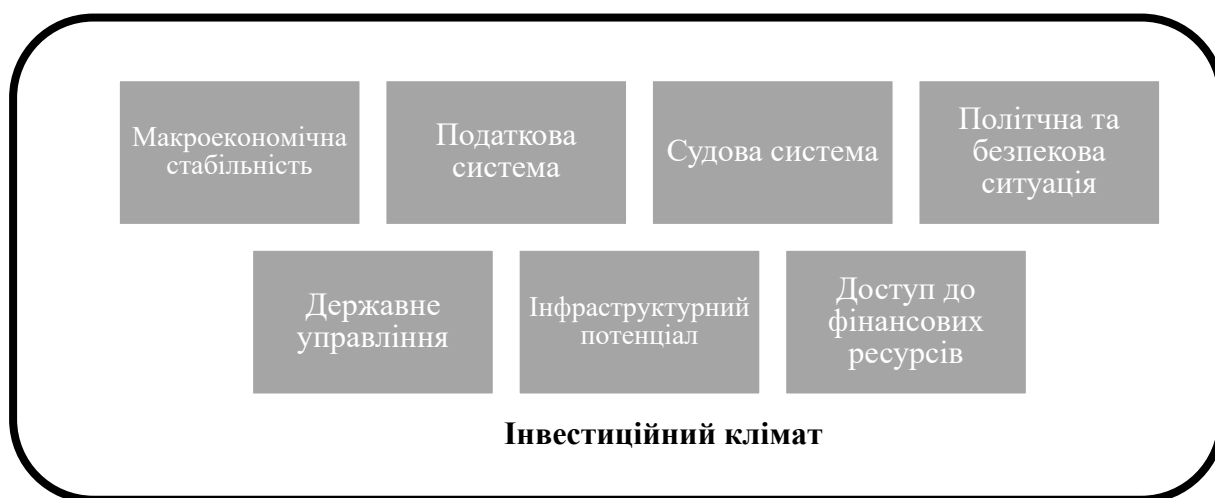
Рис. 1. Складові інвестиційного клімату

показник, що включає економічні, правові, політичні, соціальні та інституціональні компоненти. На рисунку 1 показано складові інвестиційного клімату.