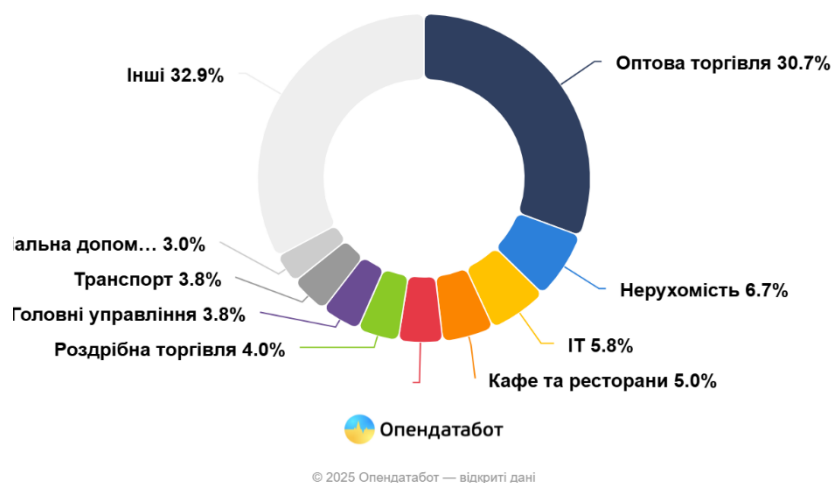
Рис.3. Види діяльності компаній з іноземними власниками