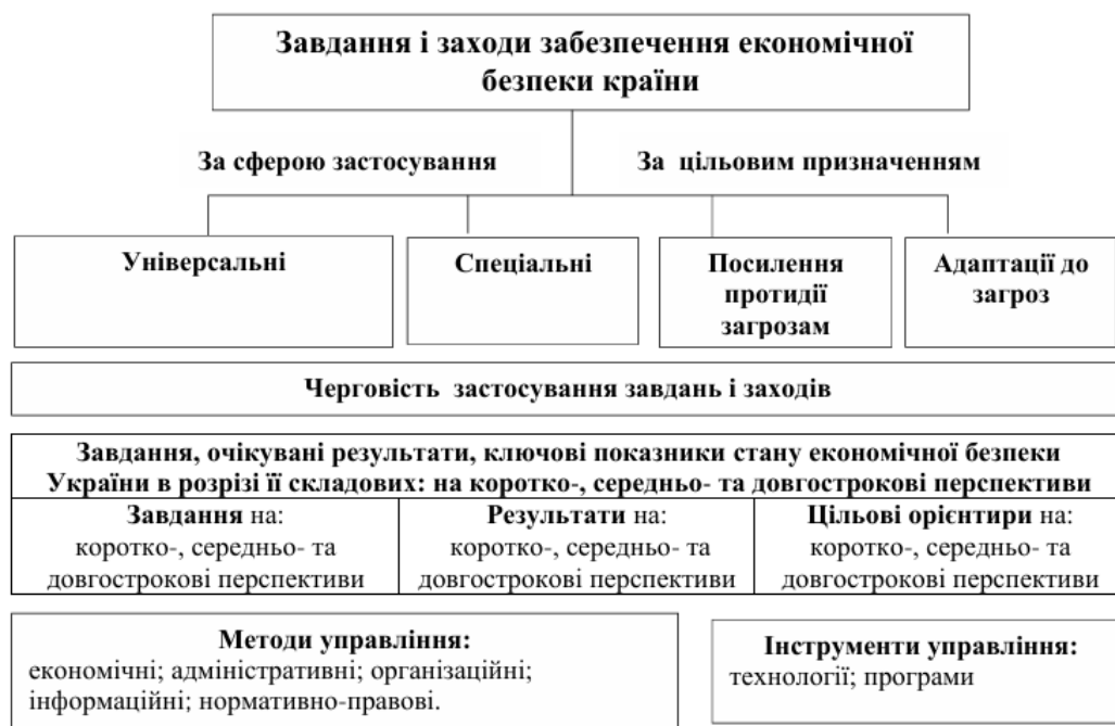
Рисунок 2 – Класифікація комплексу завдань і заходів забезпечення економічної безпеки країни. План Відновлення

Класифікація комплексу завдань і заходів забезпечення економічної безпеки країни деталізована за ознаками: за сферою застосування на універсальний та спеціальний комплекси заходів забезпечення економічної безпеки країни; за цільовим призначенням – направлені на посилення протидії загрозам і небезпекам, що передбачає, зокрема, своєчасне виявлення та усунення уразливостей і дії по сприянню адаптації до загроз і деструктивних впливів широкого спектру. Запропоновані заходи характеризуються, з одного боку, ступенем важливості (залежно від того, які завдання вони реалізують і наскільки реалізовані завдання важливі (пріоритетні)), а з іншого боку – характеризуються ресурсоємністю (наявними обмеженими можливостями країни в умовах післявоєнної відбудови: фінансові можливості держави, людський капітал, час).